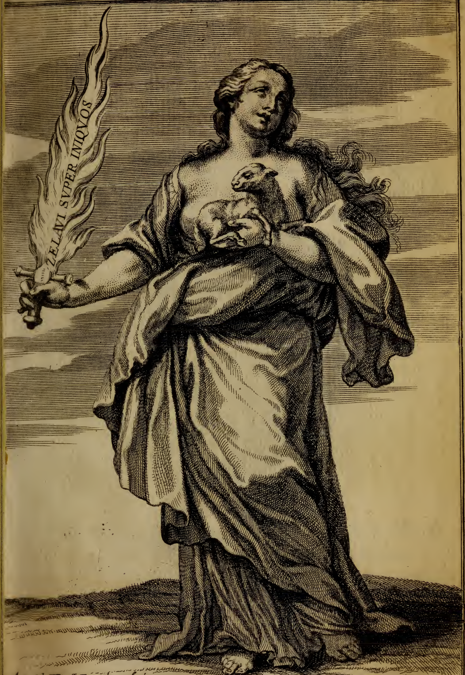
Arnoldo Van Westerhout fecit.